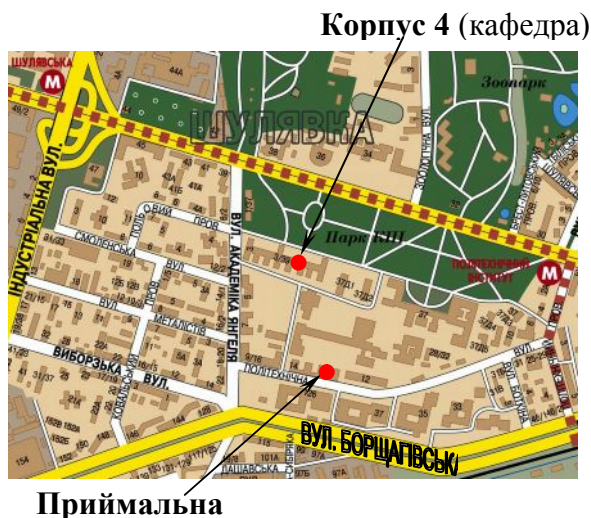
Корпус 4 (кафедра)